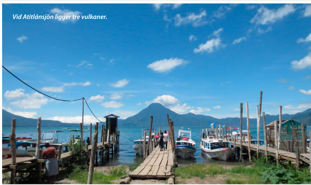
Vid Atitlánsjön ligger tre vulkaner.