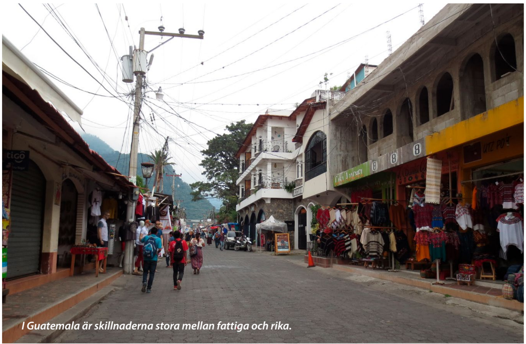
I Guatemala är skillnaderna stora mellan fattiga och rika.