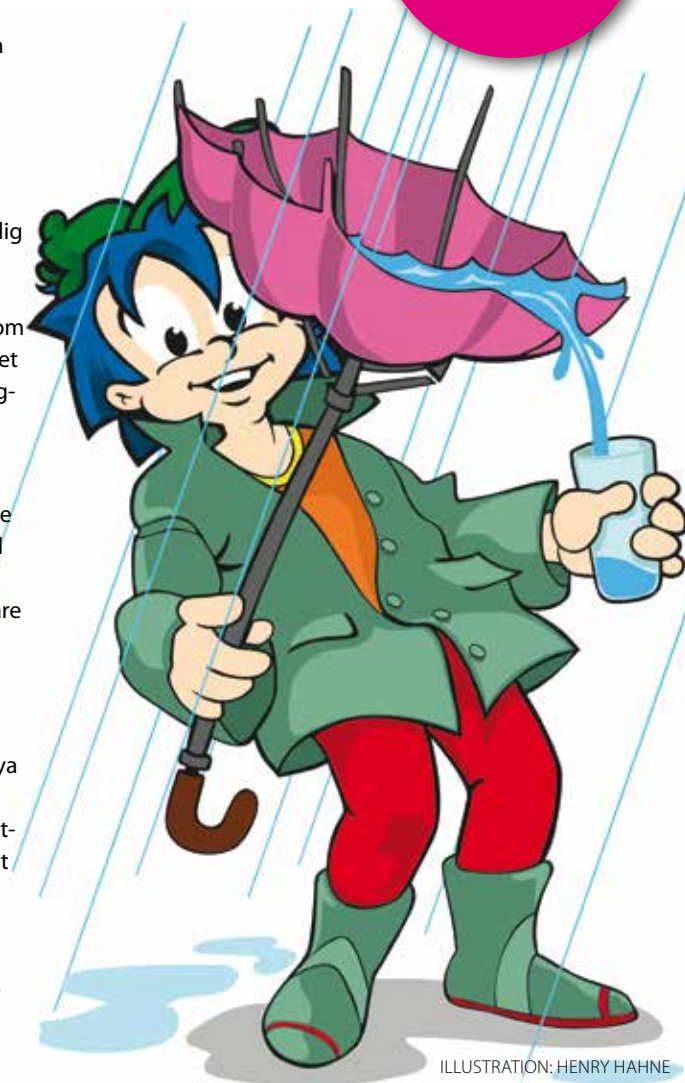
ILLUSTRATION: HENRY HAHNE