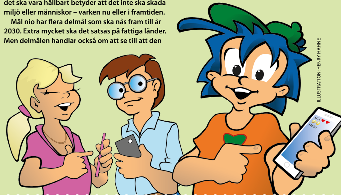
ILLUSTRATION: HENRY HAHNE

Innovationer betyder ungefär samma sak som "uppfinningar" eller "att tänka nytt".