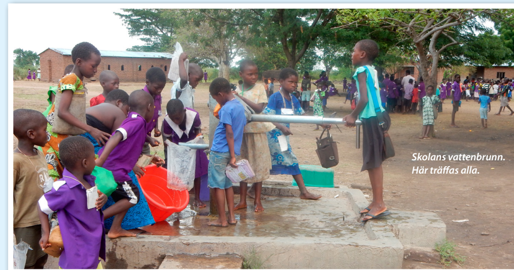
Skolans vattenbrunn. Här träffas alla.