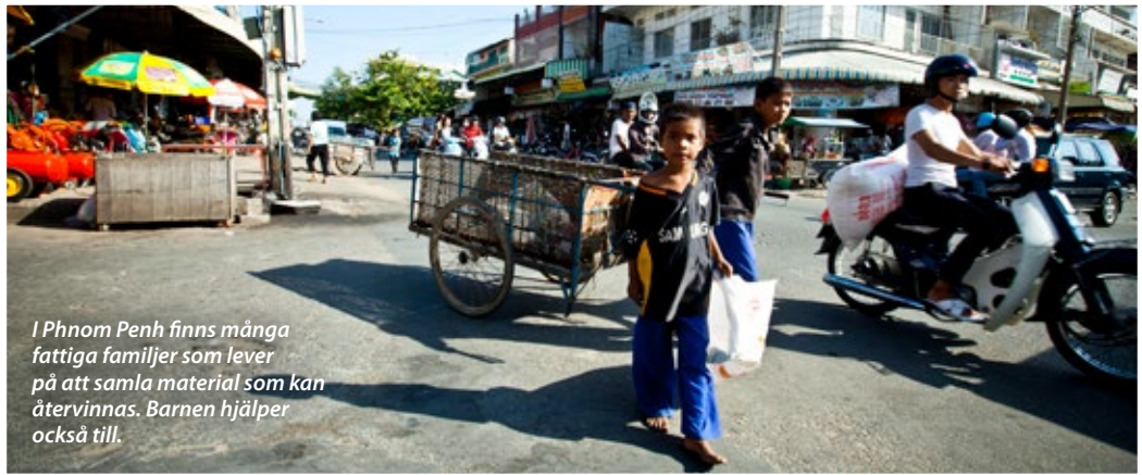
I Phnom Penh finns många fattiga familjer som lever på att samla material som kan återvinnas. Barnen hjälper också till.