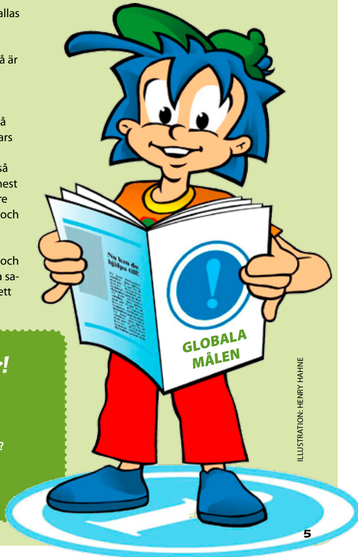
ILLUSTRATION: HENRY HAHNE

Det kallas ibland för grön ekonomi, när vi försöker göra det bättre för både människor, djur och natur.